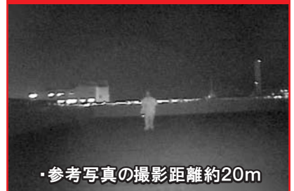
実際の夜間撮影映像